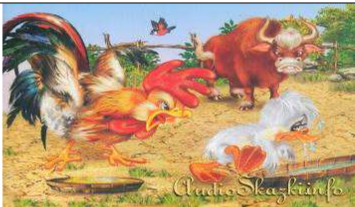
Право на уважение, гражданство