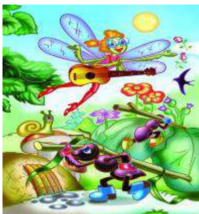
Право на труд и вознаграждение

Это лишь некоторые права, которые отражены в «Конвенции о правах ребенка».