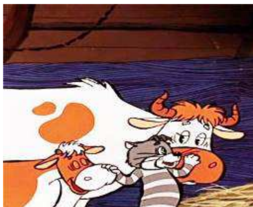
Право на имущество