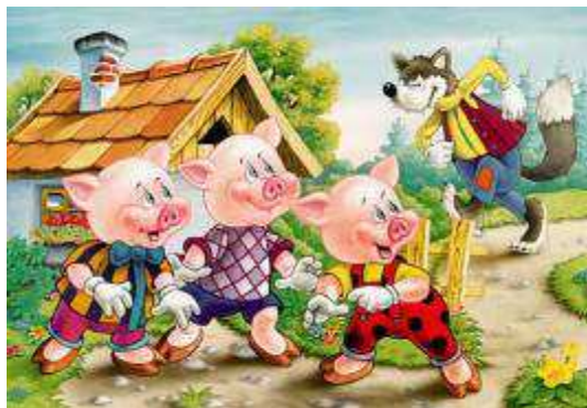
Право на защиту